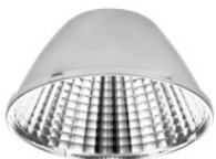
550098000500 LEDspot3C-C-P R100- Reflector-24D