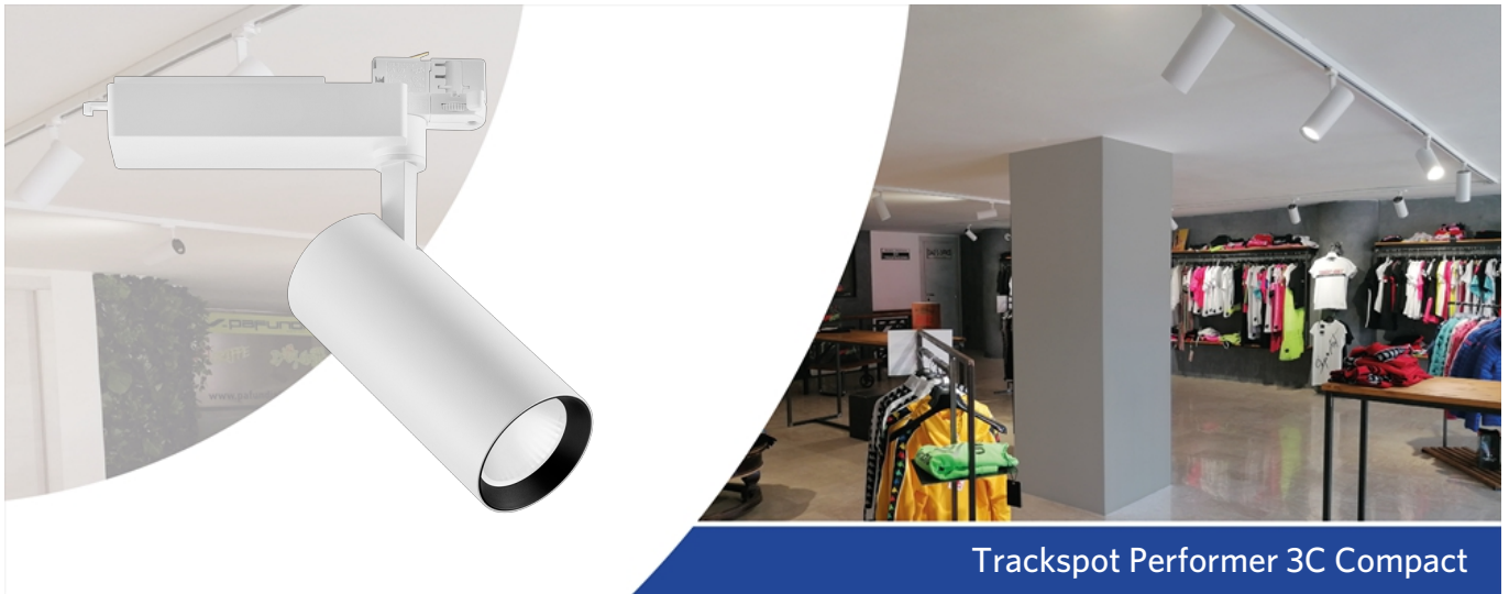
Trackspot Performer 3C Compact