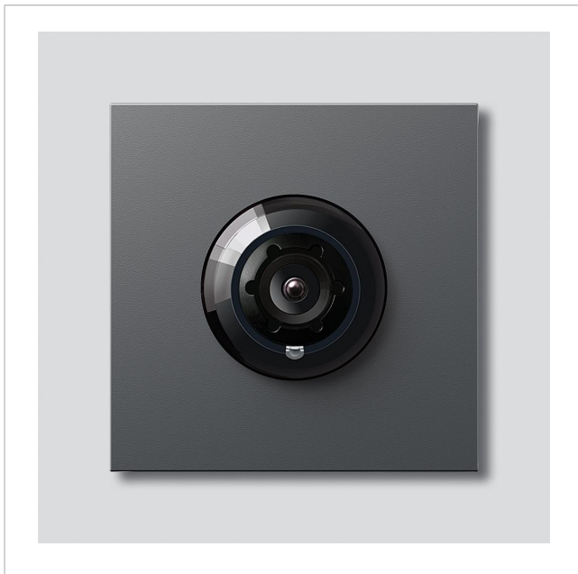
Access-Camera 130 voor Siedle Vario ACM 673-03 DG 200048205-03