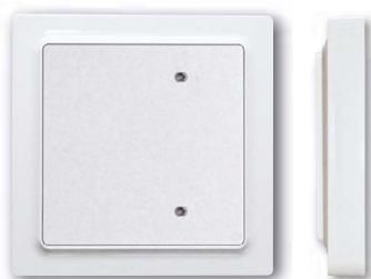
Bus-Taster mit Wippe