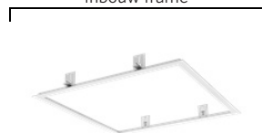
542098009600 LEDPanelRc Sq600-Frame-WH