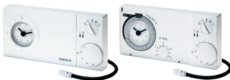
easy 3 ft / easy 3 fw