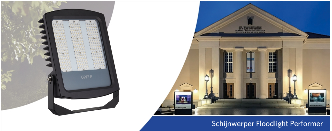
Schijnwerper Floodlight Performer