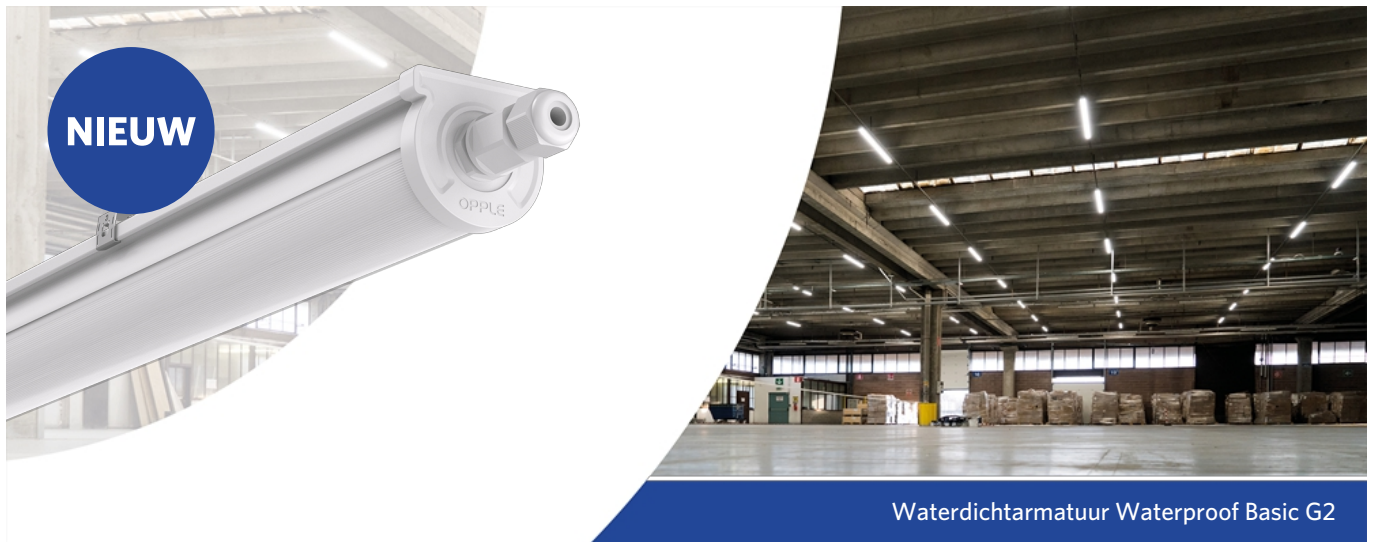
Waterdichtarmatuur Waterproof Basic G2