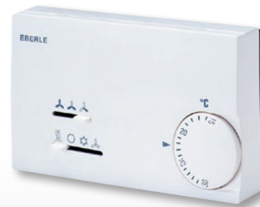
KLR-E 527 22