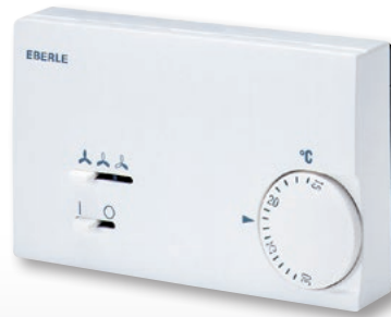
KLR-E 527 21

AC controller for residential and office applications – KLR-E 7000 series