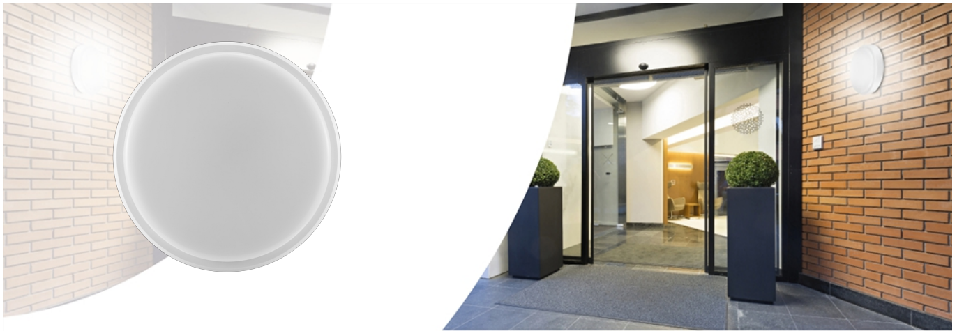
Plafond-/wandarmatuur Wall-Mounted Performer