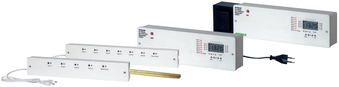
IN STAT 868 -a4