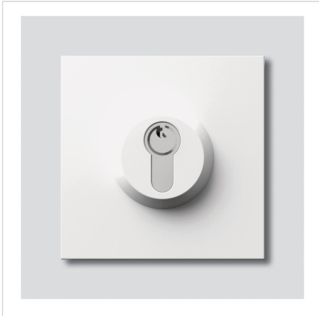
Slot-module SM 611-01 W 200019404-01