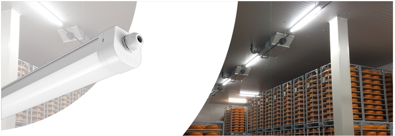
Waterdichtarmatuur Waterproof EcoMax G2