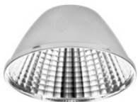
550098000300 LEDSpot3C-C-P R85-Reflector-24D