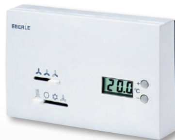
KLR-E 527 24