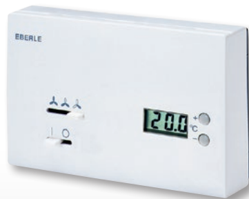
KLR-E 527 23