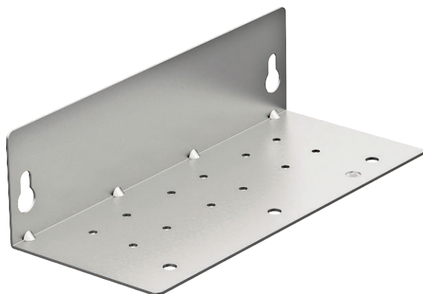
Montāžas plātne, 3 polu