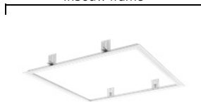
542098009600 LEDPanelRc Sq600-Frame-WH