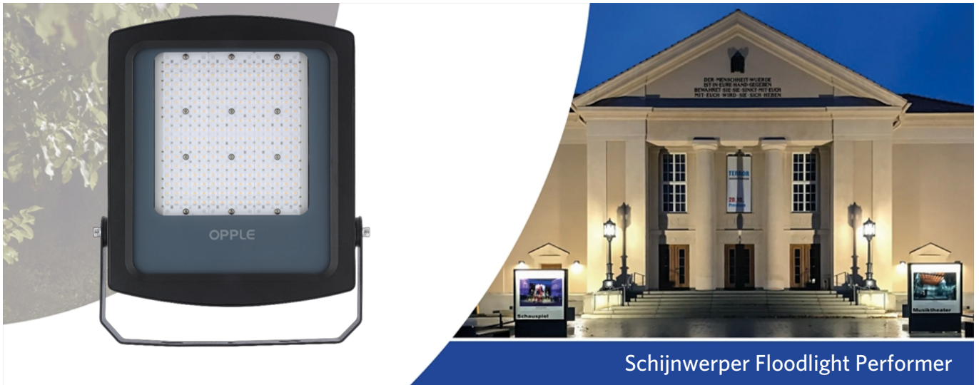
Schijnwerper Floodlight Performer