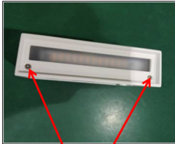
Figure 1 Remove the screws