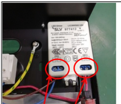
Figure 5 Loose the screws and then remove the wire