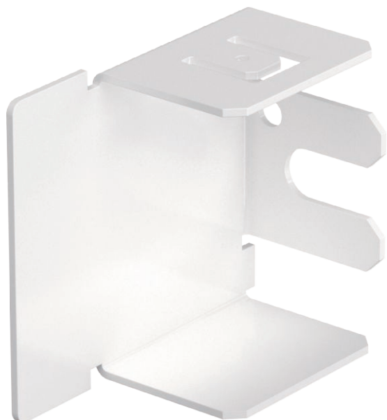
Gala elements LKM kanālu aizvēršanai.