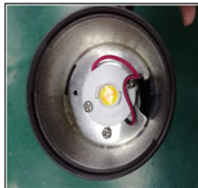
Figure3 Remove the reflector