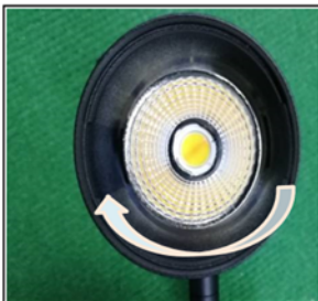
Figure2 Remove the front cover