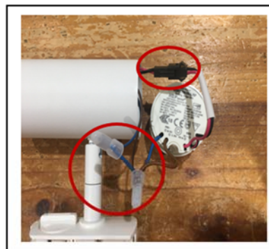
Figure2 Loose the connection