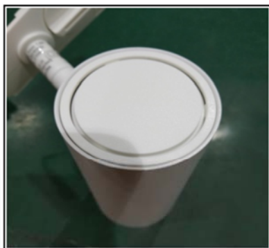
Figure1 Remove the top cover