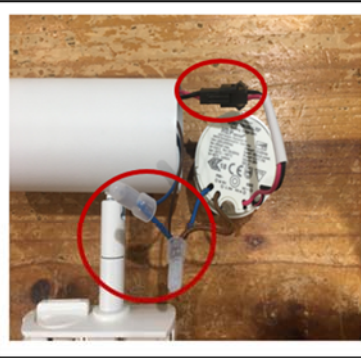
Figure2 Loose the connection