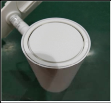
Figure1 Remove the top cover