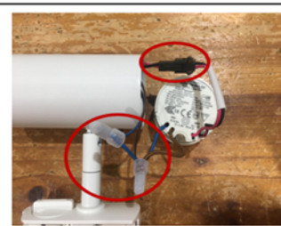
Figure2 Loose the connection