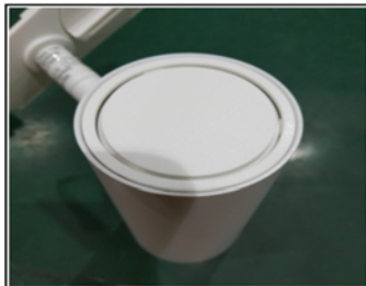
Figure1 Remove the top cover