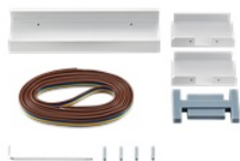
599006008900 LEDLima Connection-Kit