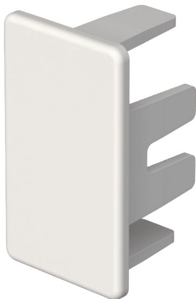
Gala elements WDK kanālu aizvēršanai.