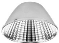
550098000500 LEDSpot3C-C-P R100- Reflector-24D