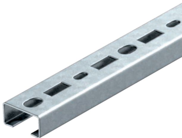
Perforēta profila sliede, spraugas platums 17 mm, 150 x 35 x 18