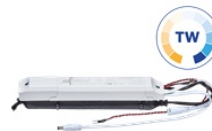
542098000800 LEDPanelRC-SI U19 EM-kit 1h