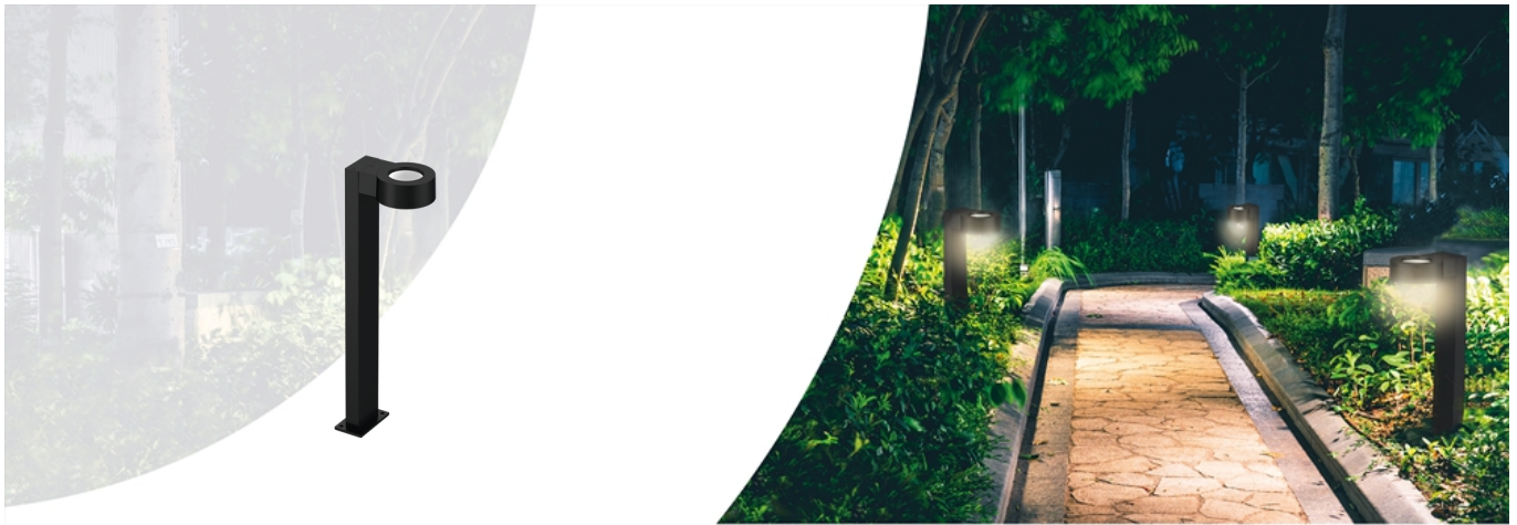
Tuin-/voetpadverlichting Bollard Luke