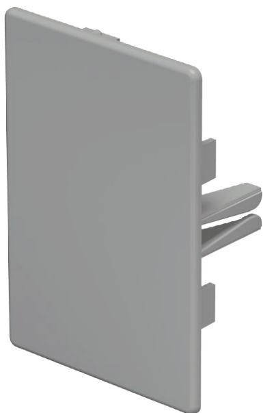
Gala elements WDK kanālu aizvēršanai.