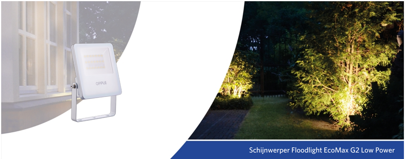
Schijnwerper Floodlight EcoMax G2 Low Power