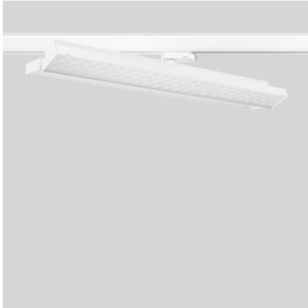
Projecteurs apparents 4051859755227 L 569, B 119, H 75

Rails au plafond blanc signalisation, mat (RAL 9016)