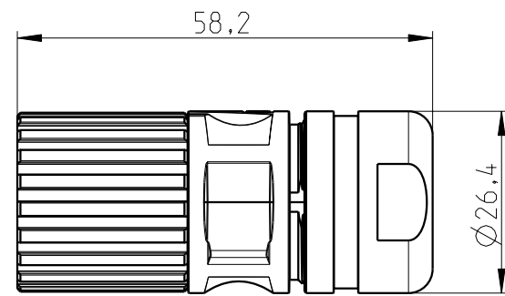
socket face female

Transfer or duplication of this document as well as the utilisation or communication of its content are not permitted unless express consent is granted. Violations give rise to claims for damages. All rights reserved in case of patent, utility model or design patent registrations. Tolerance specifications do not include clearances inherent in the design.