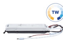
542098000800 LEDPanelRC-SI U19 EM-kit 1h 542098000900 LEDPanelRC-SI U19 EM-kit 3h