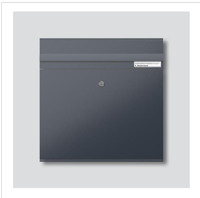
Brievenbusmodule met inwerpklep BKM 611-4/4-0 AG 210005016-00